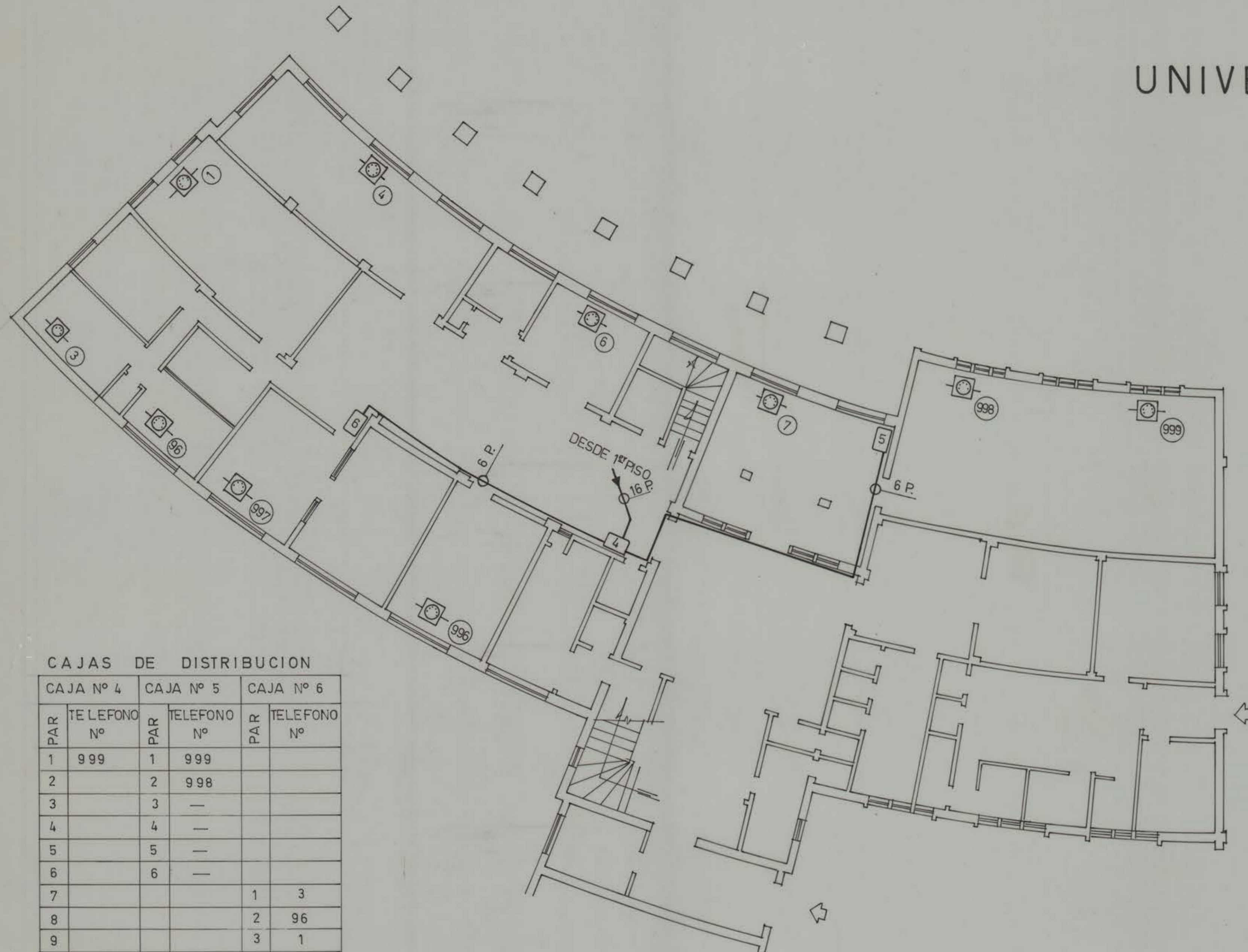
CAJAS DE DISTRIBUCION