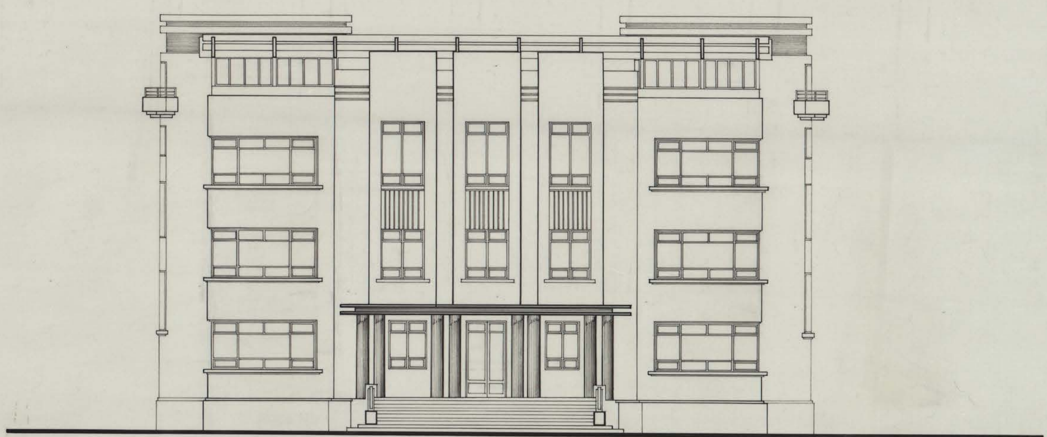
ELEVACION ACCESO ESCALA 1:100