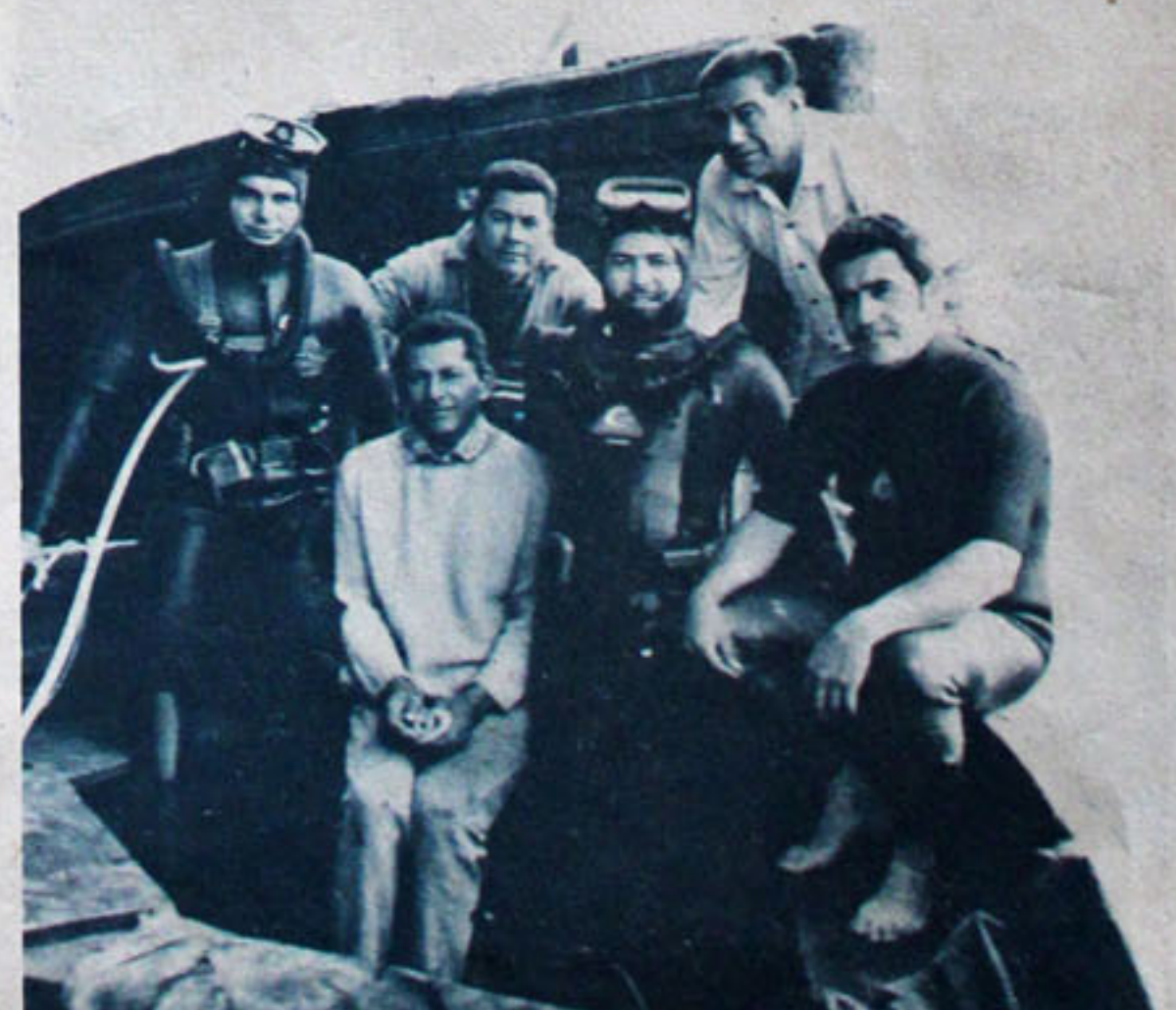
EN NOVIEMBRE de 1970, el grupo de buzos "Nautilus", se retrató en el puerto de Caldera, durante una de sus faenas en ese lugar. Fue cuando repararon el metalero japonés "Houn Maru", que había sufrido una avería.