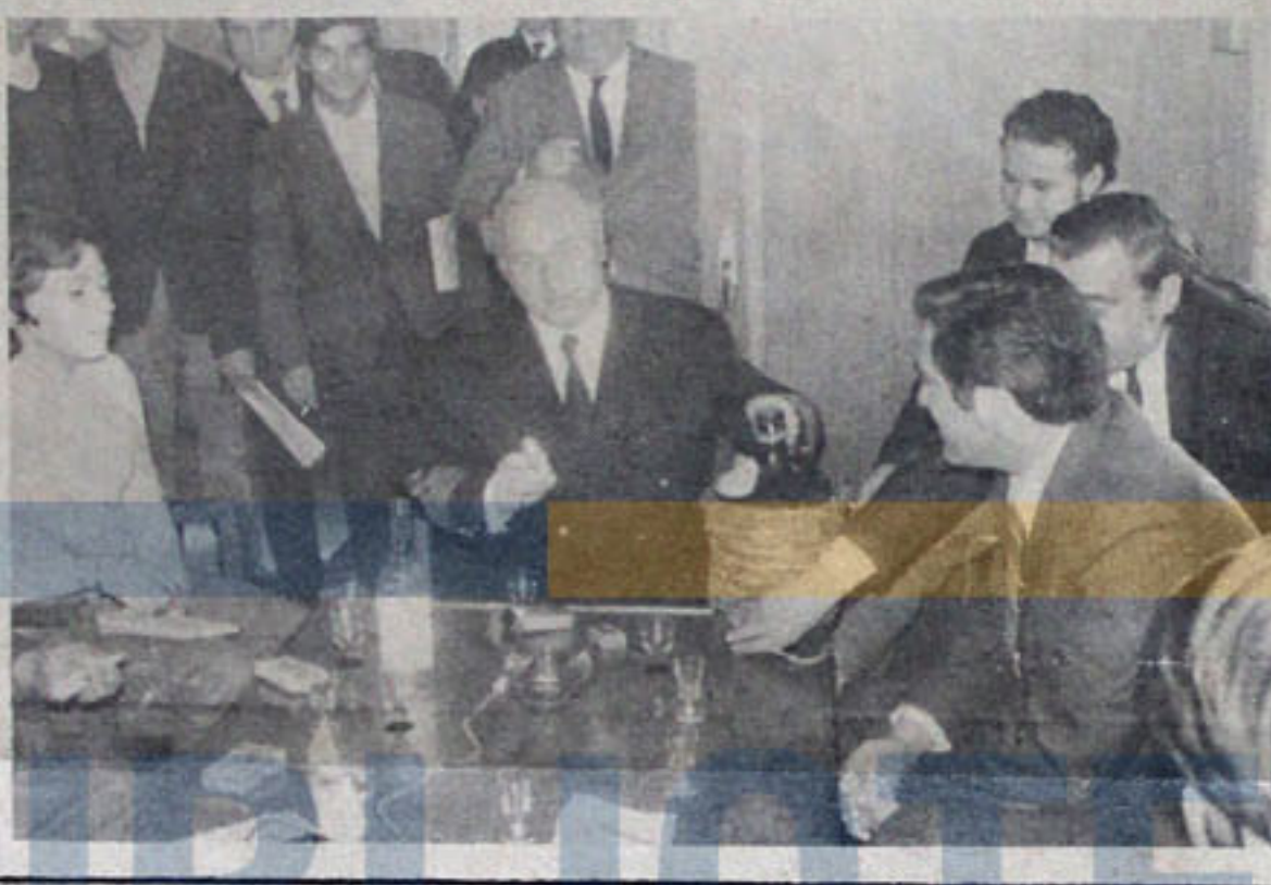
LA TIPICA GARRAFA de vino tinto llevaron los dirigentes de la Central Unica de Trabajadores a los soviéticos de la motonave "Kimovs".