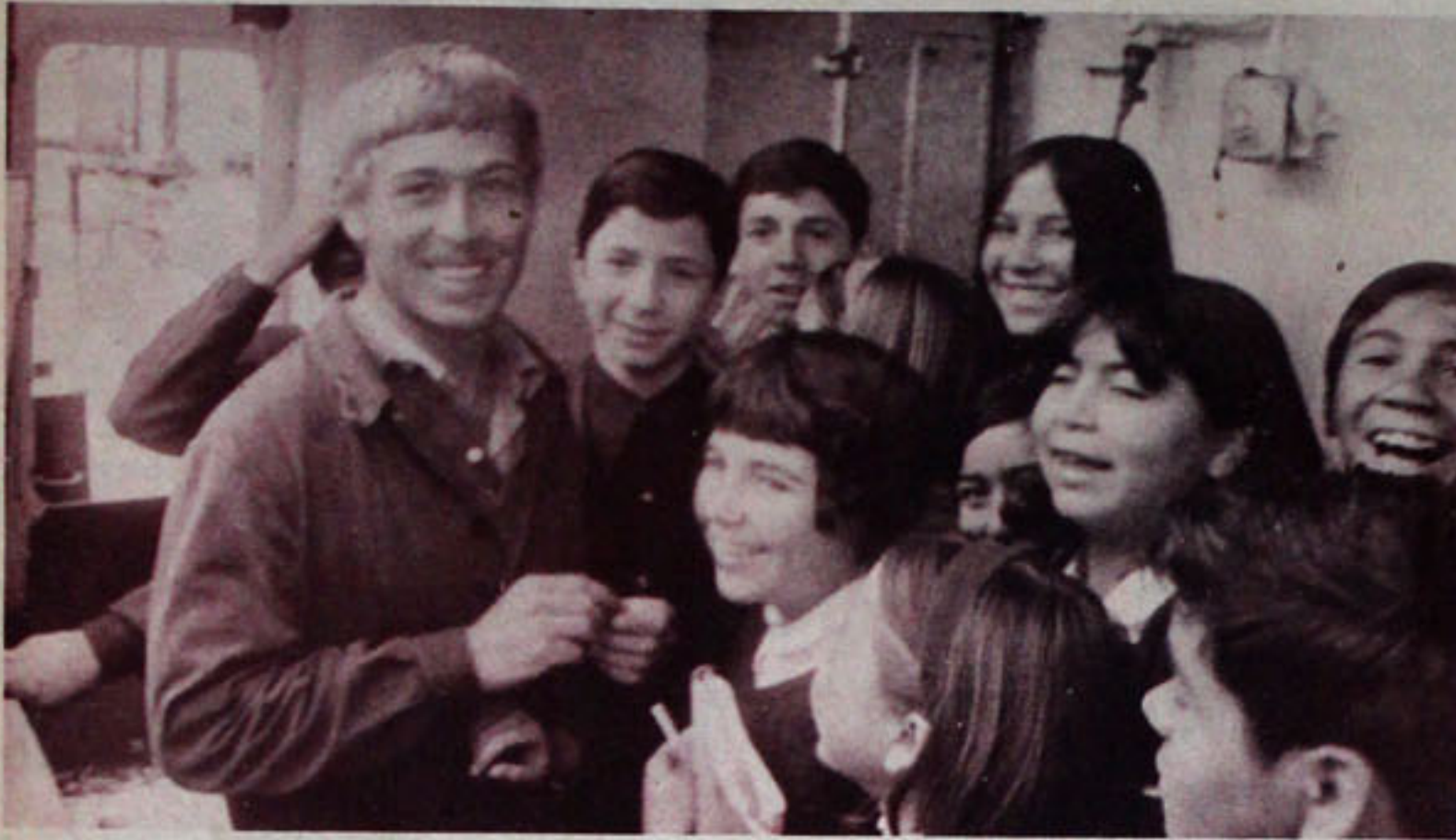
LAS LOLITAS no podían faltar, un grupo de calceñeras rodea a un tripulante de la motonave rusa, que llegó hasta Talcahuano con un cargamento de abono mexicano.

Una verdadera guerra fría se ha suscitado estos días entre la Gobernación Departamental y la Corporación Edilicia de Talcahuano, con ocasión de los preparativos de las próximas elecciones municipales.