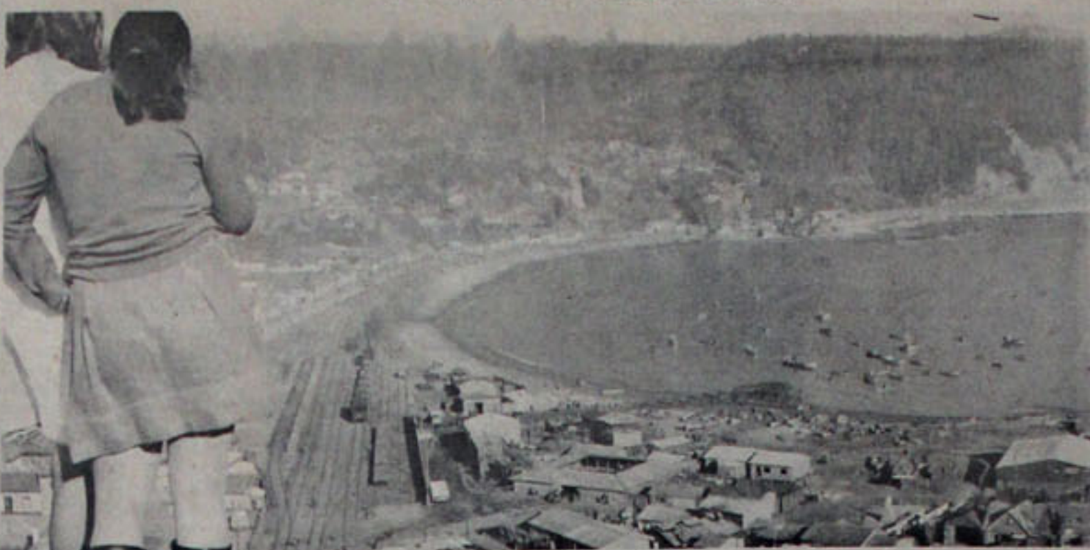
ESPERANZAS LOTINAS: La construcción de nuevas viviendas y el mejoramiento de la urbanización del puerto lotino constituye una de las preocupaciones fundamentales, cuyos efectos se verán en el cambio de rostro que tendrá lo que hasta ahora ha sido una chata y gris comunidad.