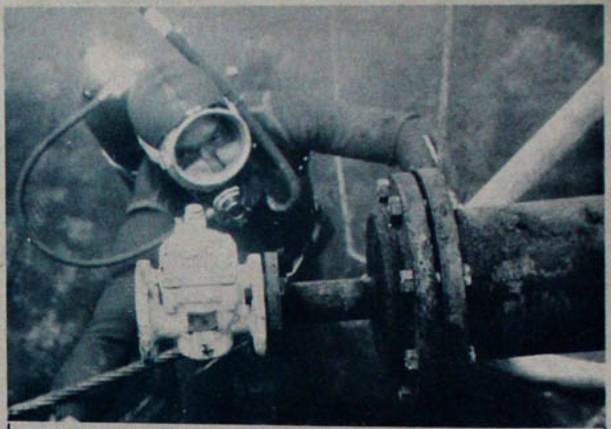
UNO DE LOS integrantes del grupo de buzos autónomos "Nautilus", desconectando una válvula a cañería submarina. El trabajo fue ejecutado en Vinapu, Isla de Pascua.

Todas las socias de los centros de madres tendrán derecho a este beneficio, previa comprobación de su carácter de socias de la institución.