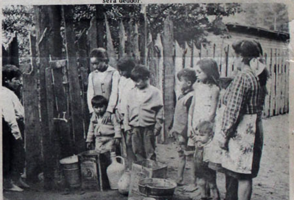
EL DRAMA DEL AGUA. - Hileras de tarros, baldes y jarros esperan turno para recoger el vital líquido. Una llave, alimenta a 14 familias. No es un problema aislado. Es la situación general que se presenta en Santa Juana.

Y LO ULTIMO: EL ALCANTARILLADO Si algunas familias gozan de la ventaja de contar con agua y electricidad, no pueden decir lo mismo del alcantarillado. Este es un problema que afecta a ricos y pobres, sin distinciones. Santa Juana nunca ha contado con un sistema de desagüe de las aguas servidas. Los que tienen medios económicos han hecho sus propias instalaciones. Quienes no cuentan con el dinero para ello, tienen que conformarse con los "pozos negros" o letrinas, en el mejor de los casos.